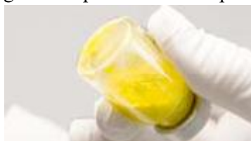
Reconstituire incompletă: particule vizibile