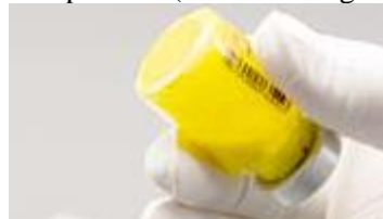
Reconstituire completă: fără particule vizibile

Figura B: Se va verifica pentru existența pulberii neînglobate în suspensie și se va agita din nou dacă este cazul