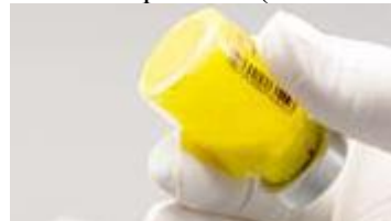
Reconstituire completă: fără particule vizibile

Figura B: Se va verifica pentru existența pulberii neînglobate în suspensie și se va agita din nou dacă este cazul