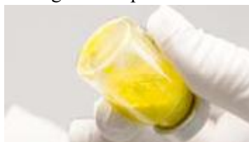
Reconstituire incompletă: particule vizibile