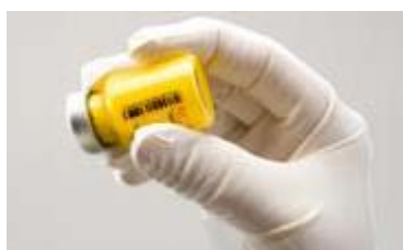
Figura C: Se agită ferm flaconul

Dacă se formează spumă, flaconul se lasă să stea pentru a permite disiparea spumei. Dacă medicamentul nu este utilizat imediat, se va agita puternic pentru refacerea suspensiei. Suspensia reconstituită de ZYPADHERA rămâne stabilă în flacon timp de până la 24 ore.