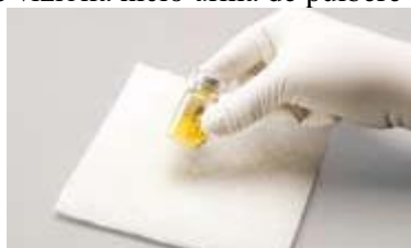
Figura A: Agitați ferm pentru amestecare